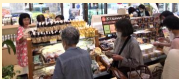
ショップには健康を考えた商品がズラリ。