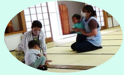
新たなサポーターさんが誕生し活躍中です。