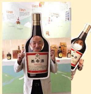
年表の前で、田代事務局長が養命酒に変身！あら？もうお一方…(笑)